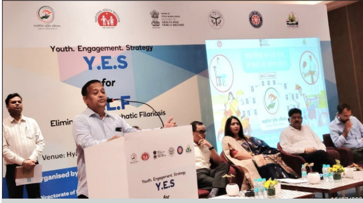
फार्मेसी काउंसिल ऑफ इण्डिया (पीसीआई) द्वारा आयोजित 'फाइलेरिया रोग उन्मुलन' कार्यशाला

दिनांक : 16 जुलाई, 2024 को फार्मेसी काउंसिल ऑफ इण्डिया (पीसीआई) द्वारा आयोजित 'फाइलेरिया रोग उन्मुलन' विषय पर लखनऊ में राष्ट्रीय सेवा योजना के साथ एक कार्यशाला का आयोजन