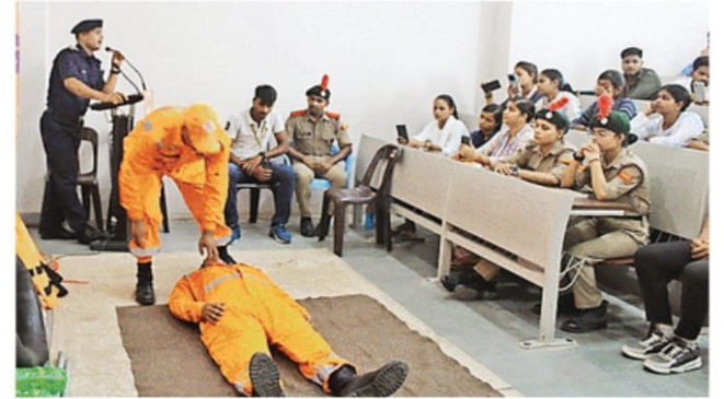
गोरखनाथ विवि में आपदा से बचाव का प्रशिक्षण देते एनडीआरएफ के जवान