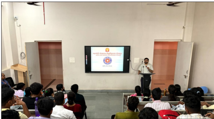
विद्यार्थियों को सम्बोधित करते हुए राष्ट्रीय सेवा योजना के समन्वयक

दिनांक : 16-30 जुलाई, 2024 को आयोजित नवप्रवेशित विद्यार्थियों के दीक्षारंभ कार्यक्रम में विश्वविद्यालय के सभी संकाय के विद्यार्थियों को