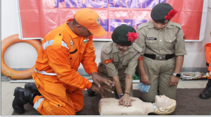
फार्मसी संकाय के नवप्रवेशित विद्यार्थियों एवं राष्ट्रीय कैडेट कोर के कैडेट्स को आपदा प्रबंधन का प्रशिक्षण देती एनडीआरएफ की टीम

दिनांक : 20 जुलाई, 2024 को महायो गी गोरखानाथ विश्वविद्यालय में एनडीआरएफ के दल ने फार्मसी विभाग के नव प्रवेशी विद्यार्थियों और एनसीसी कैडेट्स को आपदा प्रबंधन का प्रशिक्षण दिया।