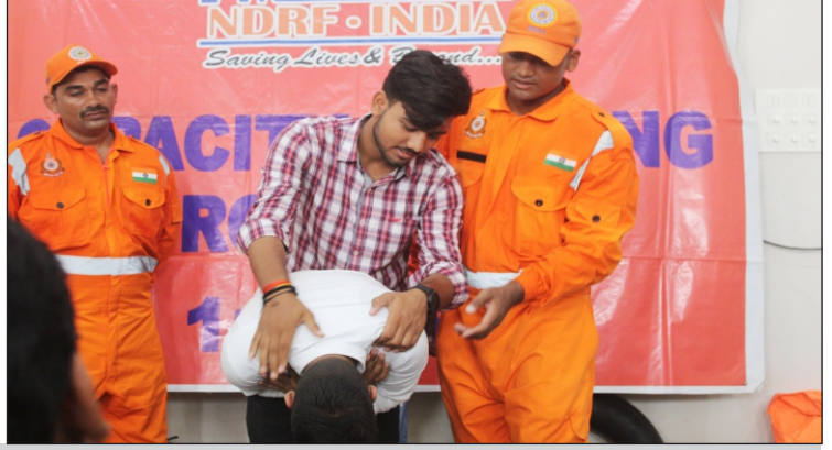
कैडेट्स को आपदा प्रबंधन का प्रशिक्षण देती एनडीआरएफ की टीम

इसमें आग जैसी आपदाओं में घायल हुए व्यक्तियों को अस्पताल से पूर्व चिकित्सा के बारे में बताया गया और साथ ही आपदाओं में प्रयोग किए जाने वाले रेस्क्यू तकनीकी फंसे हुए लोगों को निकालना उन्हें प्राथमिक उपचार देने के बारे में बताया गया।