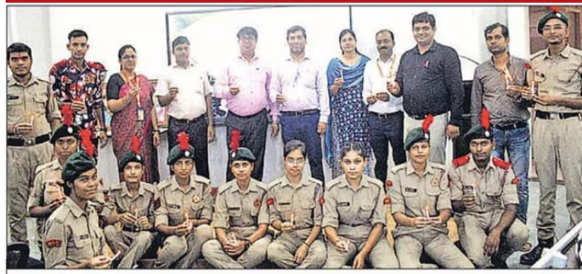
कारगिल विजय दिवस के अवसर पर शुक्रवार को दीनदयाल उपाध्याय गोरखनाथ विश्वविद्यालय की शिक्षकों और एनसीसी कैडेट ने कैडल जलाकर शहीदों को श्रद्धांजलि दी।