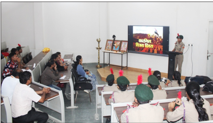
कारगिल विजय दिवस पर प्रजेंटेशन प्रस्तुत करती कैडेट

दिनांक : 26 जुलाई, 2024 को विश्वविद्यालय 102 यू.पी. महायो गी गोरखानाथ बटालियन एन.सी.सी.यूनिट के