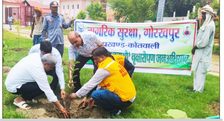
पौधारोपण करते हुए माननीय कुलपति, कुलसचिव, नागरिक सुरक्षा कोर की टीम

दिनांक : 20 जुलाई, 2024 को महायोगी गोरखनाथ विश्वविद्यालय में एक पेड़ माँ के नाम पौधारोपण लक्ष्य में सात हजार पौधे लगाकर प्रदेश में 36.50 करोड़ पौधारोपण के लक्ष्य में अपनी सहभागिता किया।