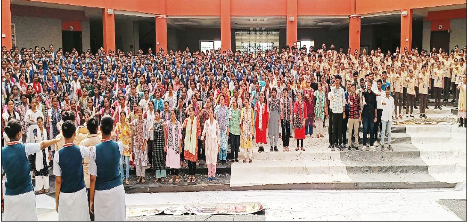
नशामुक्ति अभियान के अंतर्गत शपथ ग्रहण करते विश्वविद्यालय के विद्यार्थी

दिनांक : 20 जुलाई, 2024 को महायोगी गी गोरखानाथा विश्वविद्यालय में राष्ट्रीय सेवा योजना द्वारा नशामुक्ति अभियान के अंतर्गत शपथ ग्रहण कार्यक्रम का आयोजन किया गया।